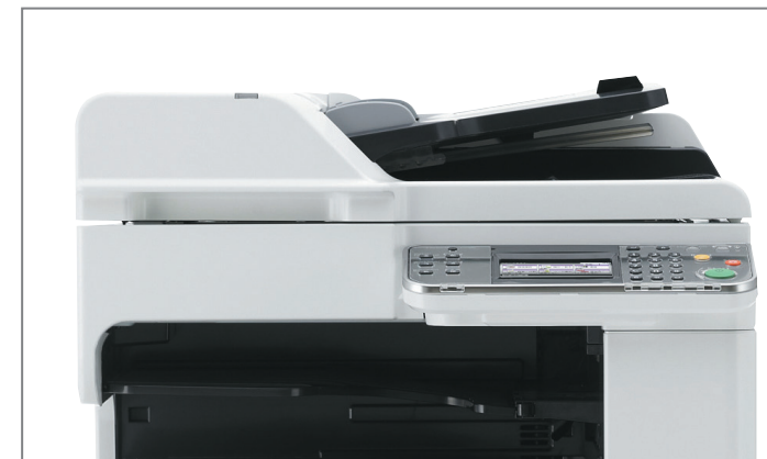
ALIMENTATORE DI ORIGINALI STANDARD

(Mifare, Legic, Multi ISO, e altri ancora). Tutte le opzioni disponibili a corredo delle d-Copia 253MF plus e 303MF plus sono concepite per essere installate celermente senza l'ausilio di attrezzature particolari anche da parte di personale non specializzato.