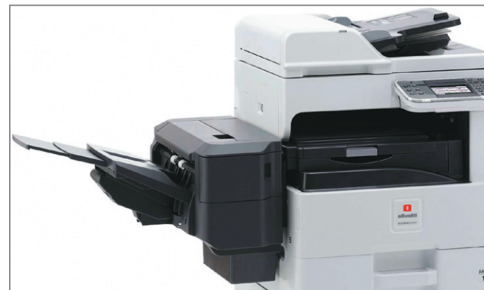
FINISHER SOSPELO (opzionale)